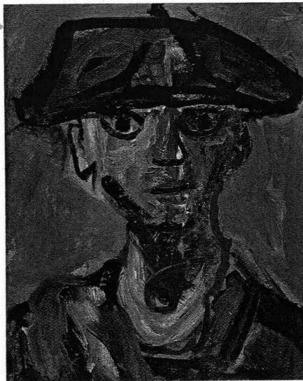
Autoportrait, 1948, huile sur carton, 23,8 x 18,8 cm © Pierre MARILLY

Rue François Desnoyer, 34200 (04 67 46 20 98).